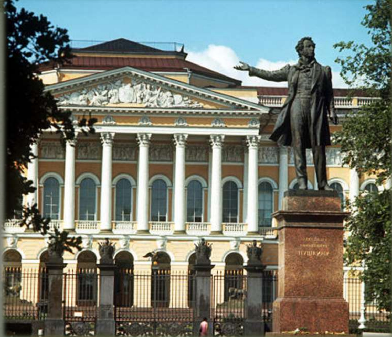
Русский музей в Санкт-Петербурге