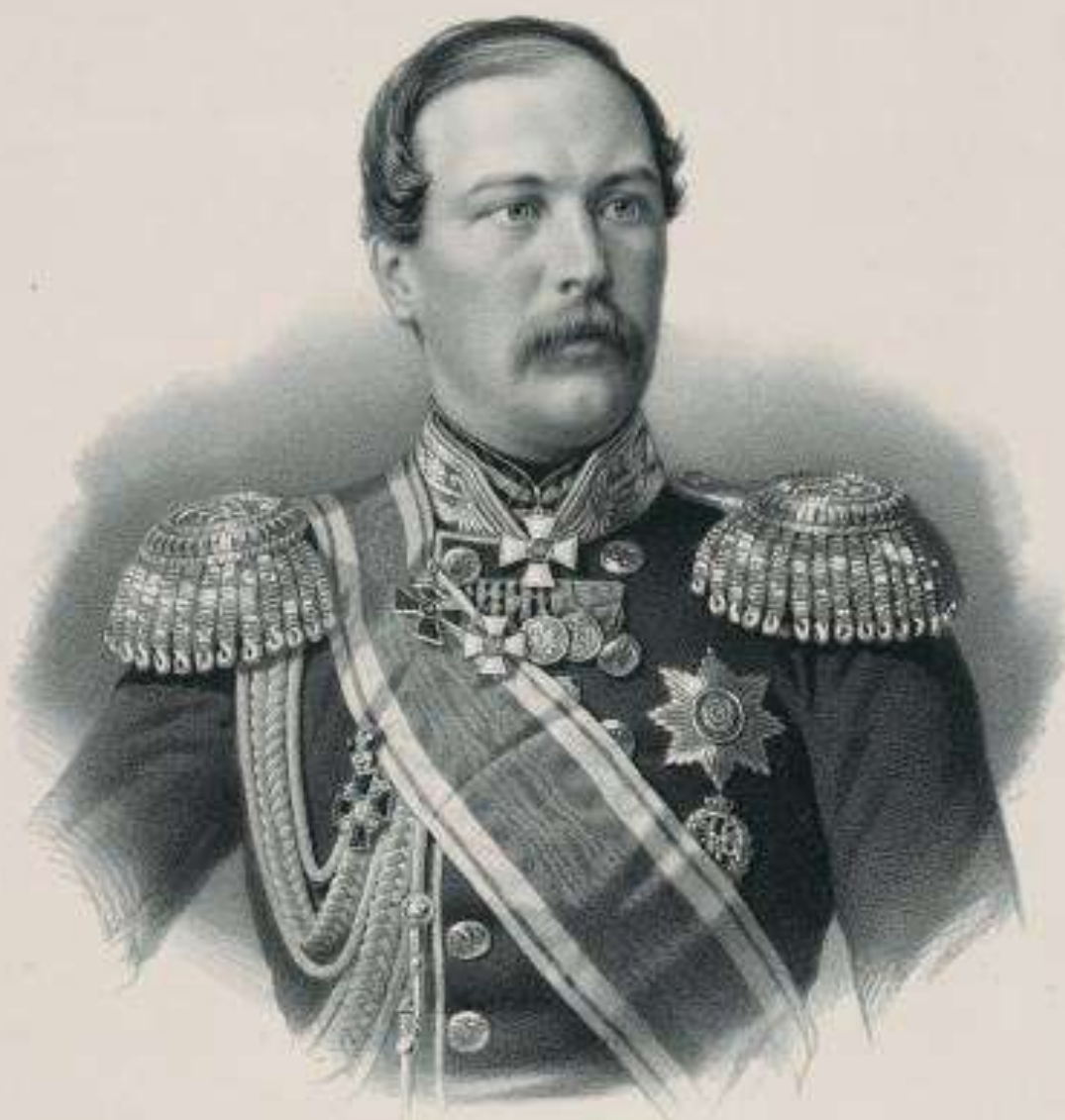
Портрет генерала-лейтенанта Николая Николаевича Мушкетера.