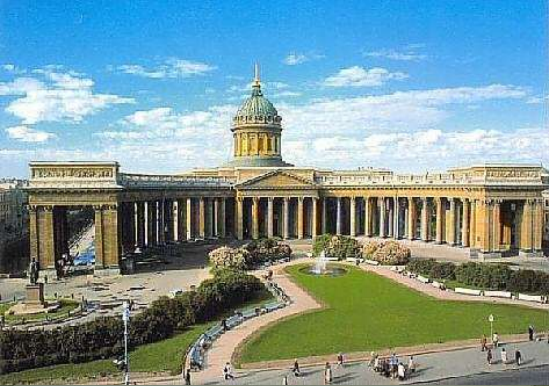
Казанский собор в Санкт-Петербурге