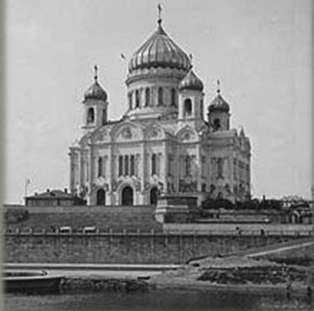
Храм Христа Спасителя