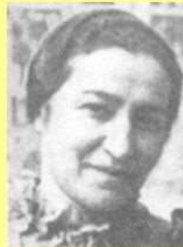
Полина Семеновна Жемчужина

За связь с ЕАК была отправлена в ссылку на пять лет жена Молотова П.С. Жемчужина (Молотов, по требованию Сталина, развелся с ней).