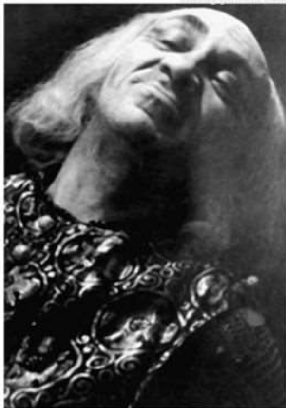
С.М. Михоэлс в роли короля Лира.

Председателем ЕАК был художественный руководитель Государственного еврейского театра (ГОСЕТа), выдающийся артист С.М. Михоэлс.