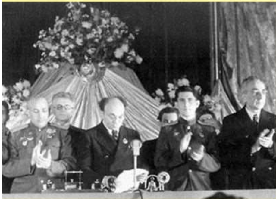
Президиум 3-го пленума Еврейского Антифашистского Комитета. В центре – С.М. Михозлс.

Оборотной стороной державного курса стало нагнетание шовинизма и антисемитизма. В 1946 г. глава МГБ В.С. Абакумов начал сбор компрометирующих материалов против Еврейского Антифашистского комитета (ЕАК), созданного в 1941 г. для получения финансовой помощи СССР со стороны еврейских организаций США.