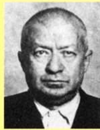
Соломон Абрамович Лозовский, председатель Совинформ- бюро