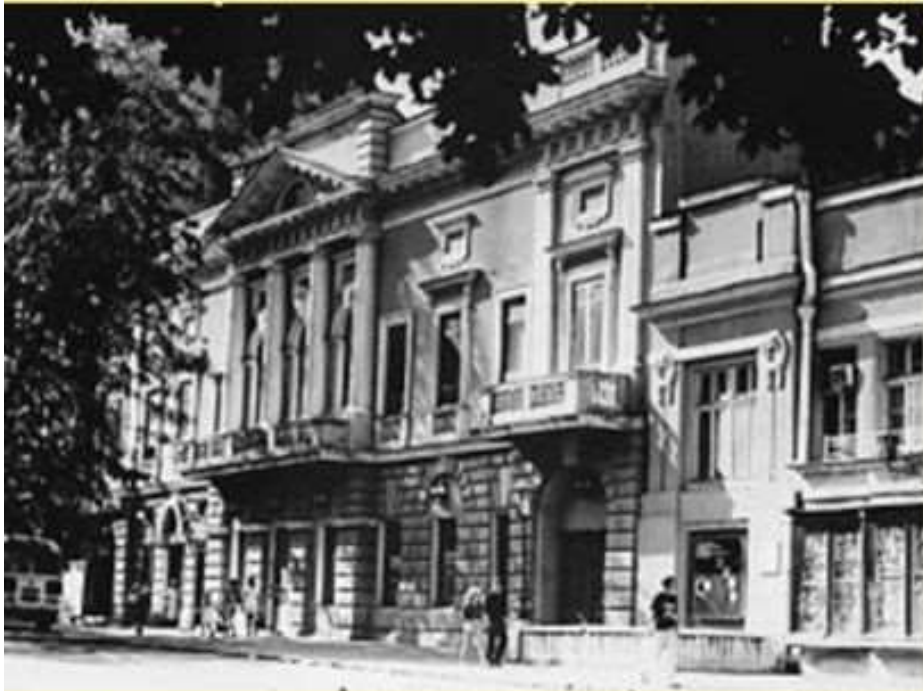
Государственный еврейский театр в Одессе. Закрит в 1948 г.

Репрессии не ограничились Еврейским Антифашистским комитетом.