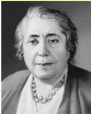
Лина Соломоновна Штерн, академик АН СССР, физиолог, геронтолог.

Лине Штерн сохранили жизнь, скорее всего, потому, что Сталин, страшно боявшийся смерти, интересовался работами по геронтологии.