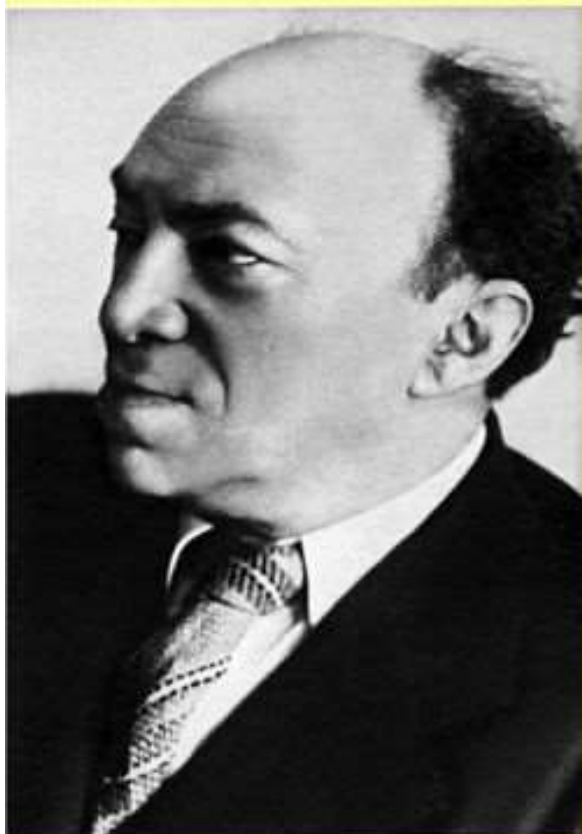
Соломон Михайлович Михоэлс

Сразу после войны откровенно антисемитские репрессии были бы крайне непопулярны за границей.