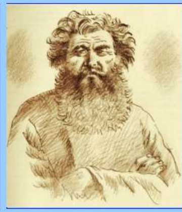
Иван Флягин - праведник